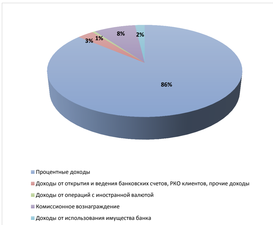
Рисунок 1. Структура доходов ООО КБ "ГТ банк" за 2017 год.

формированию резервов и переоценке иностранной валюты), в то время как в 2016 году аналогичная величина составила 92%. Таким образом, составляющая доходов от процентов по кредитам в 2017 году снизилась за счет роста доходов от всех услуг, оказываемых Банком. Доходы от комиссионного вознаграждения повысились с 7% до 8% по сравнению с прошлым отчетным периодом за счет доходов от выдачи банковских гарантий и комиссионных доходов, связанных с предоставлением кредитов (рис.1).