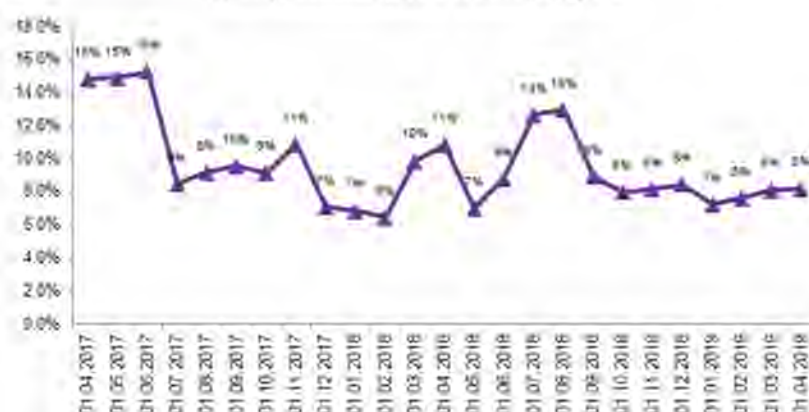
Доля рыночного риска в RWA (общ.) в %

Для оценки величины рыночного риска Банк также использует метод оценки стоимости, подверженной риску (Value at Risk, VaR), т.е. величины потерь, которая не будет превышена с вероятностью, равной доверительному уровню, либо аналогичной по экономическому смыслу экспертной оценки. При расчете VaR доверительный уровень расчета устанавливается в размере не менее 95-99%, а горизонт исторического анализа – не менее 1 года.