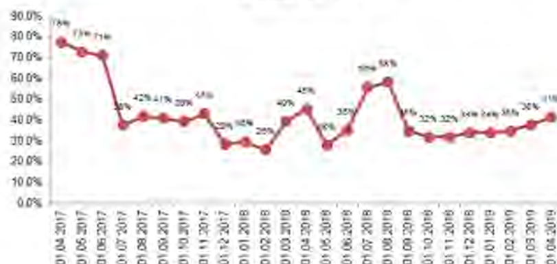
Размер рыночного риска по методике Банка России в % от капитала Банка

Динамика доли рыночного риска в общей величине активов взвешенных с учетом риска (RWA).